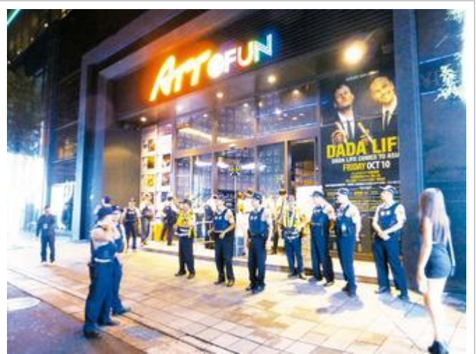
財長下令北市夜店全面查稅。

負責調查行動的財政部台北國稅局已訂出選查範圍，包括設籍台北市且以提供播放電音舞曲或嘻哈音樂、設有舞池、吧台、包廂等音樂活動空間，且一併提供餐點、飲料服務為主要經營型態的夜店營業人均在選查之列。查稅期間自10月起，直到明（2015）年1月31日為止。台北國稅局指出，這段調查期間，將查閱夜店業者的申報資料，並視其實際營業情形，輔導夜店依加值型及非加值型營業稅法規定，據實開立統一發票及報繳營業稅。